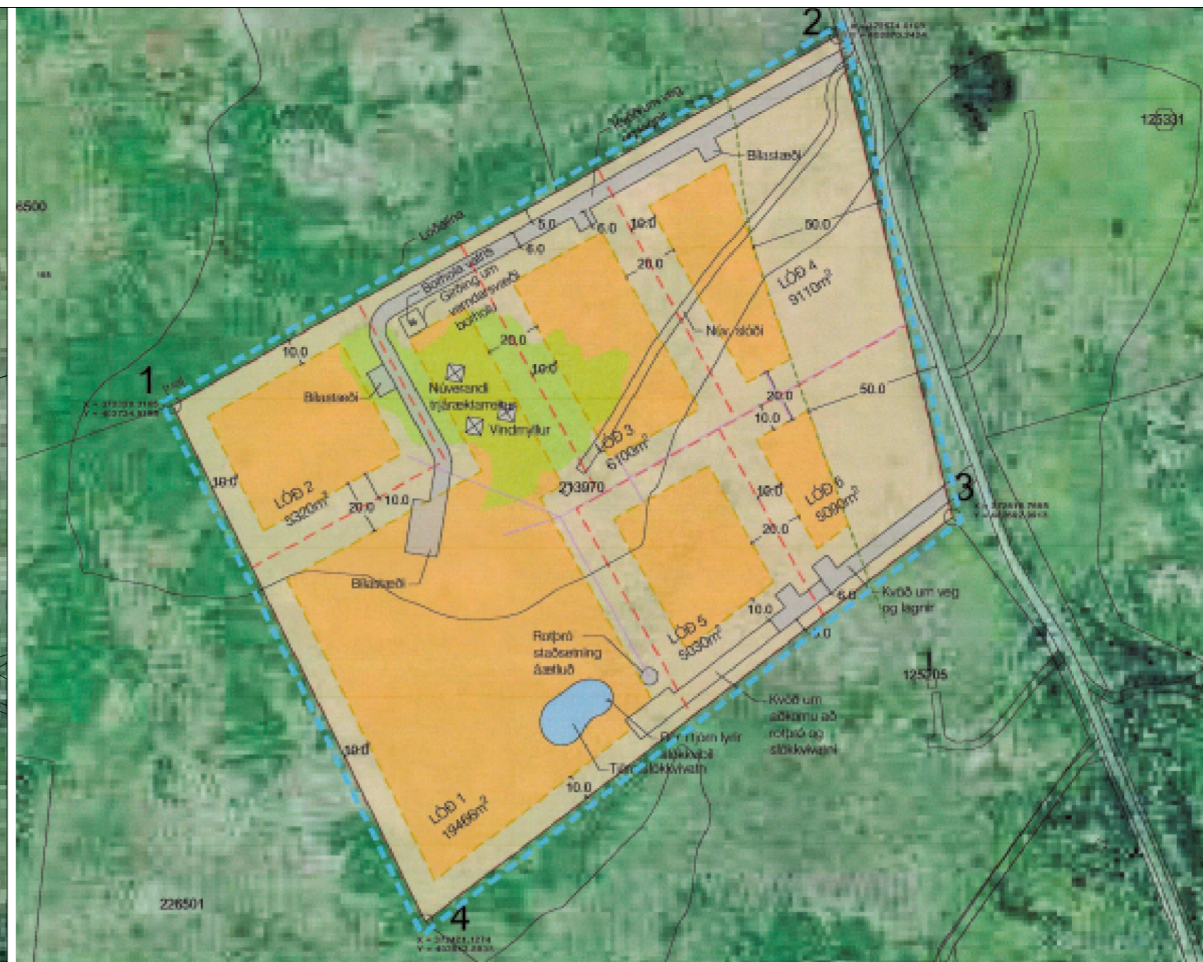
Deiliskipulag fyrir breytingu samþykkt á afgreiðslufundi skipulagsfulltrúa 3 maí 2023. Mkv um 1:2000