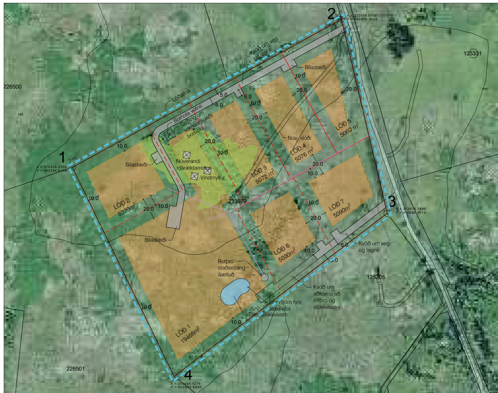
Deiliskipulag eftir breytingu mkv 1:2000