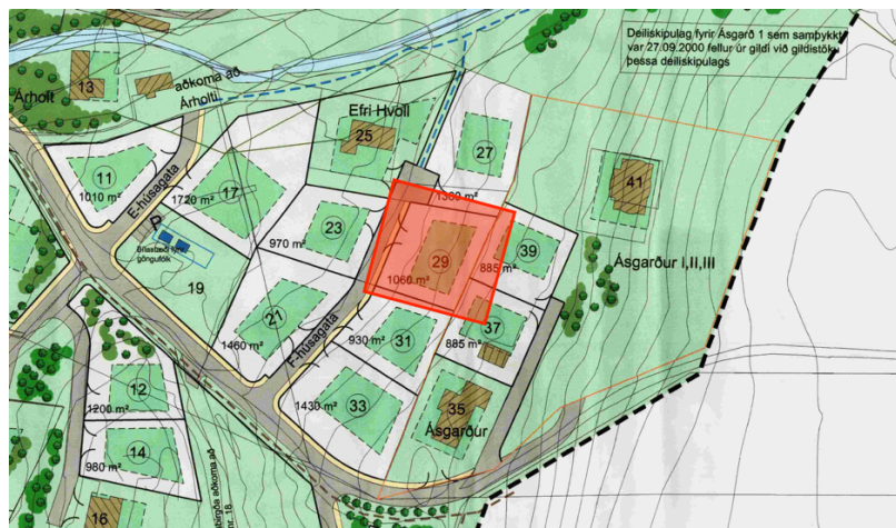
Hluti deiliskipulagsuppdráttar, samþ. 21.janúar 2004

Walter Hjaltested Arkitekt FÍA AAM Kt. 210391 - 2749