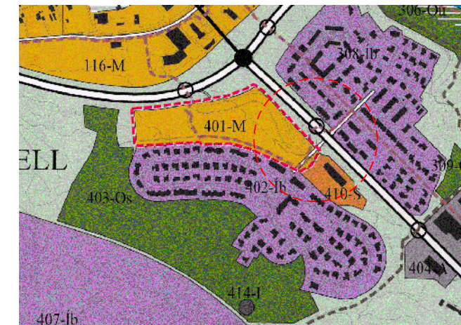
Aðalskipulag Mosfellsbæjar 2011-2030