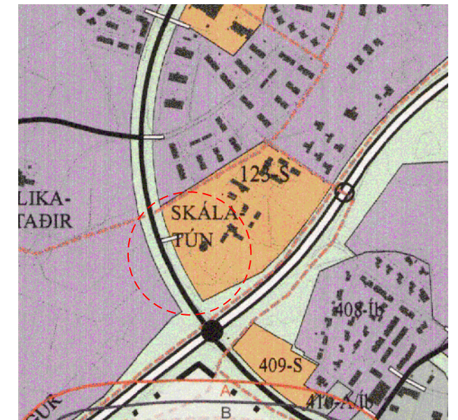
Aðalskipulag Mosfellsbæjar 2011-2030