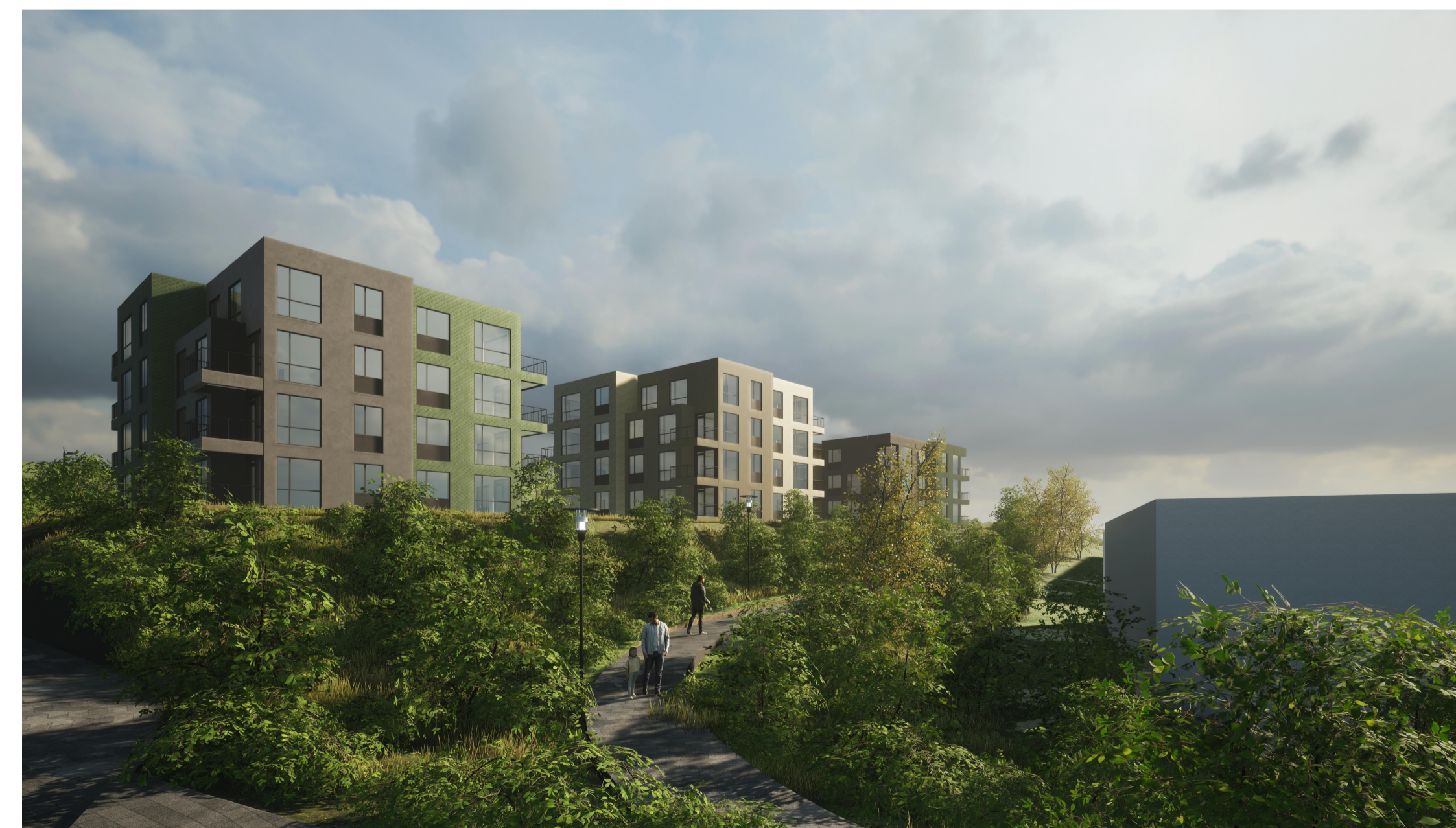
Skýringarmynd- Horft eftir stíg á milli efra og neðra svæðis til vesturs