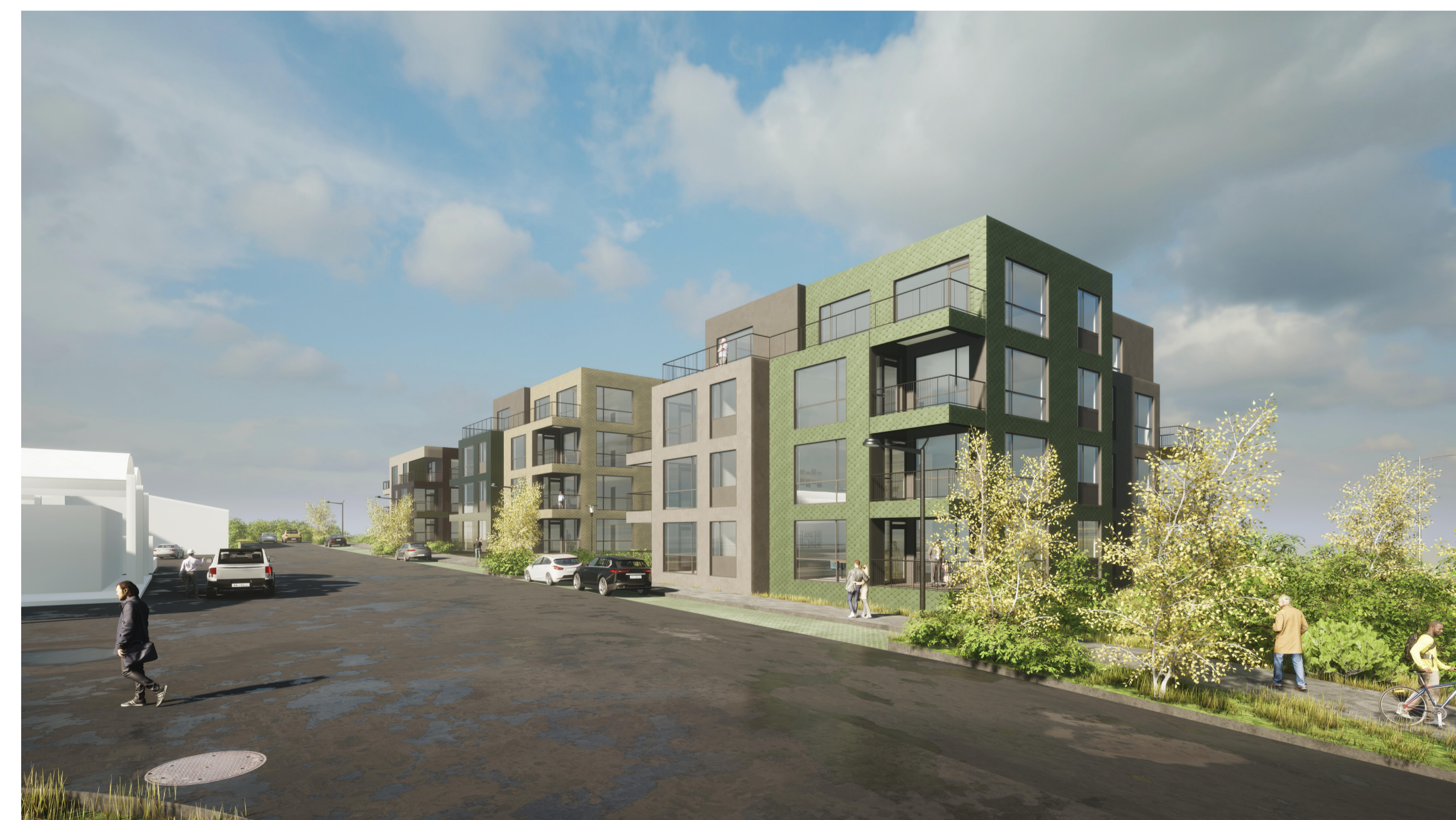
Skýringarmynd - Horft eftir Langatanga til vesturs

Undra ehf. Kil. 50224020 Hafnarvegur 105 101 Reykjavík Ísland www.undra.is info@undra.is