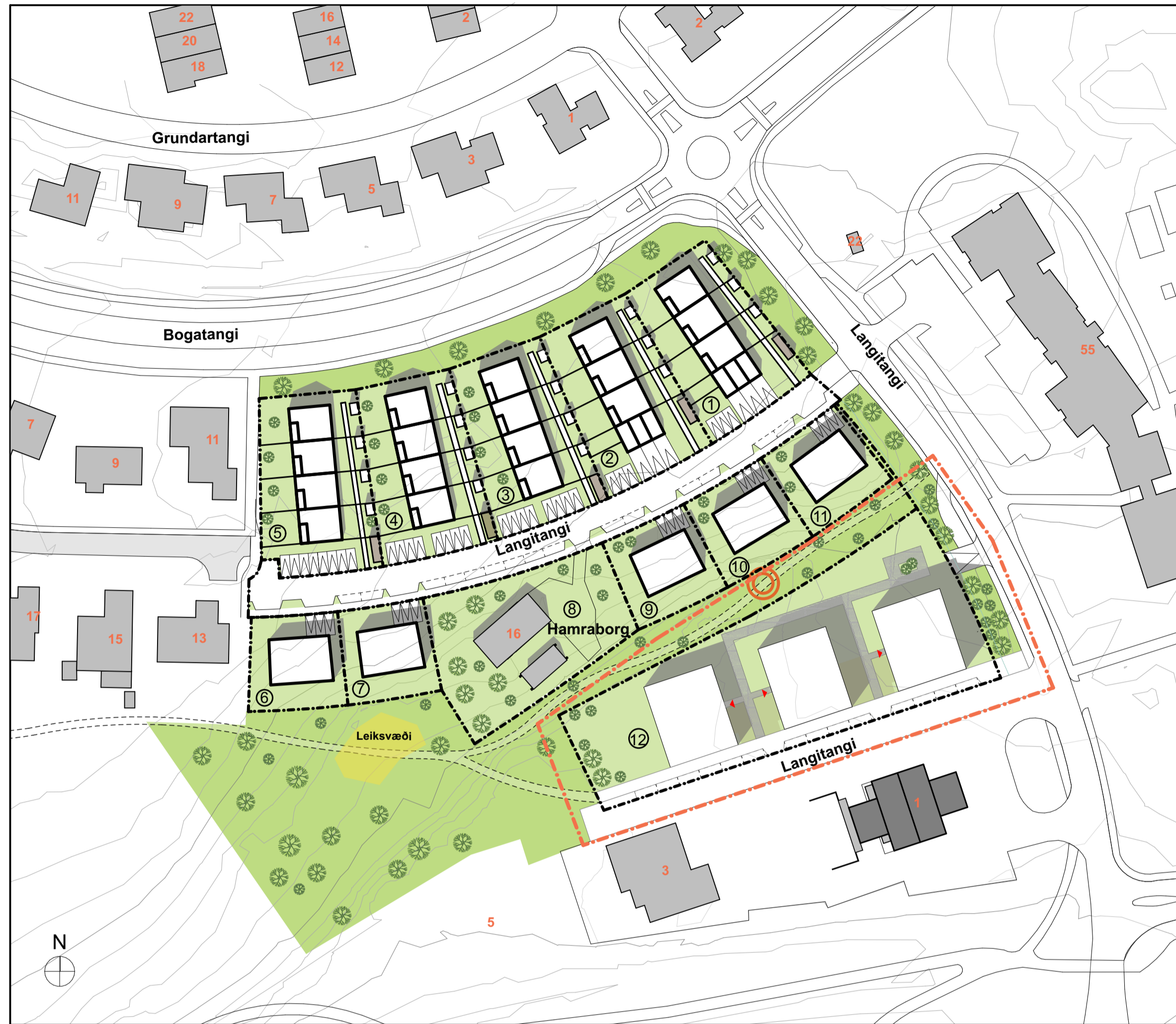
Deiliskipulagsbreyting, Skýringarmynd - Mkv 1:1000