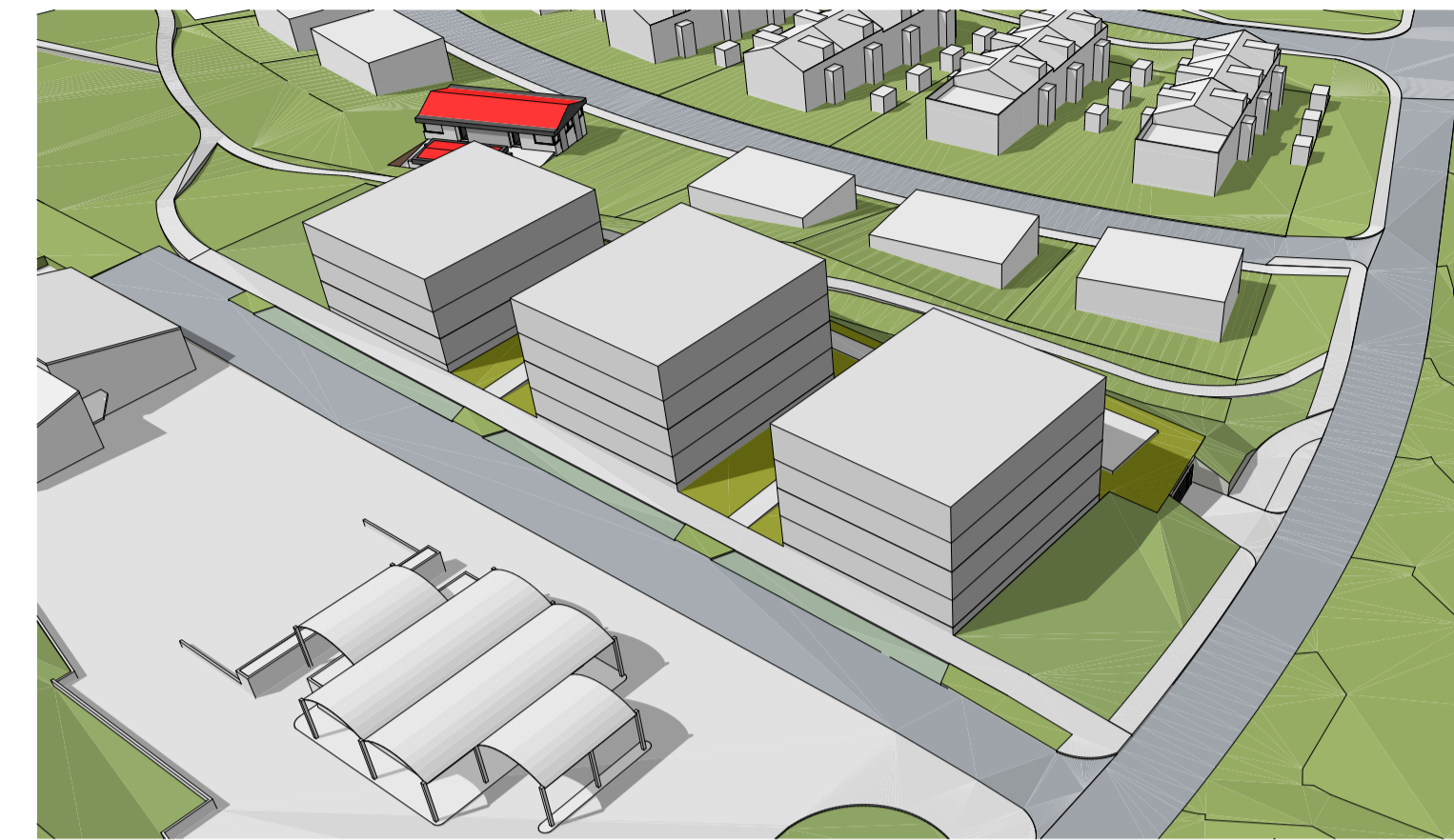
Yfirlitsmynd horft til norðurs