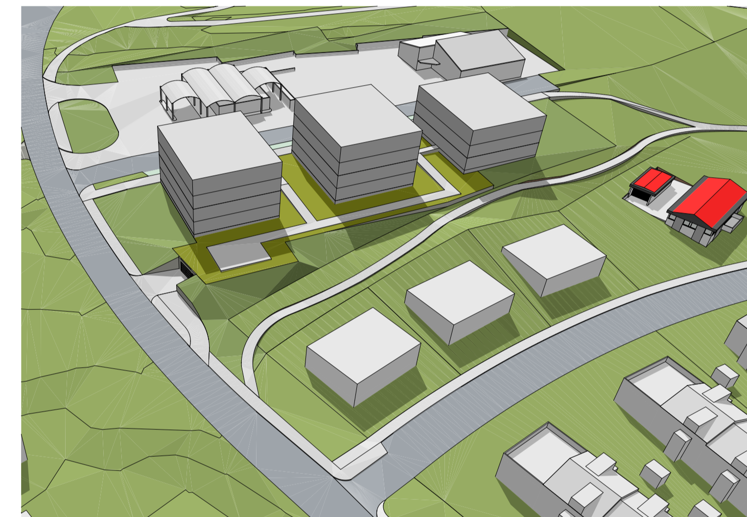
Yfirlitsmynd horft til suðurs