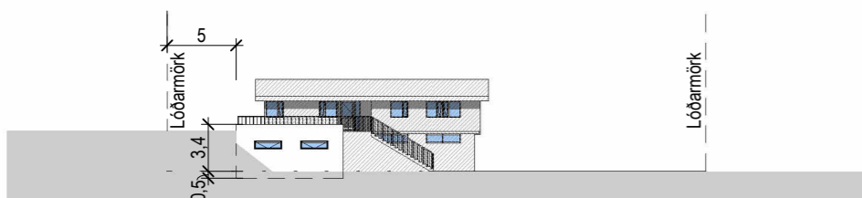
Ásýnd Norðvestur, mkv 1:500