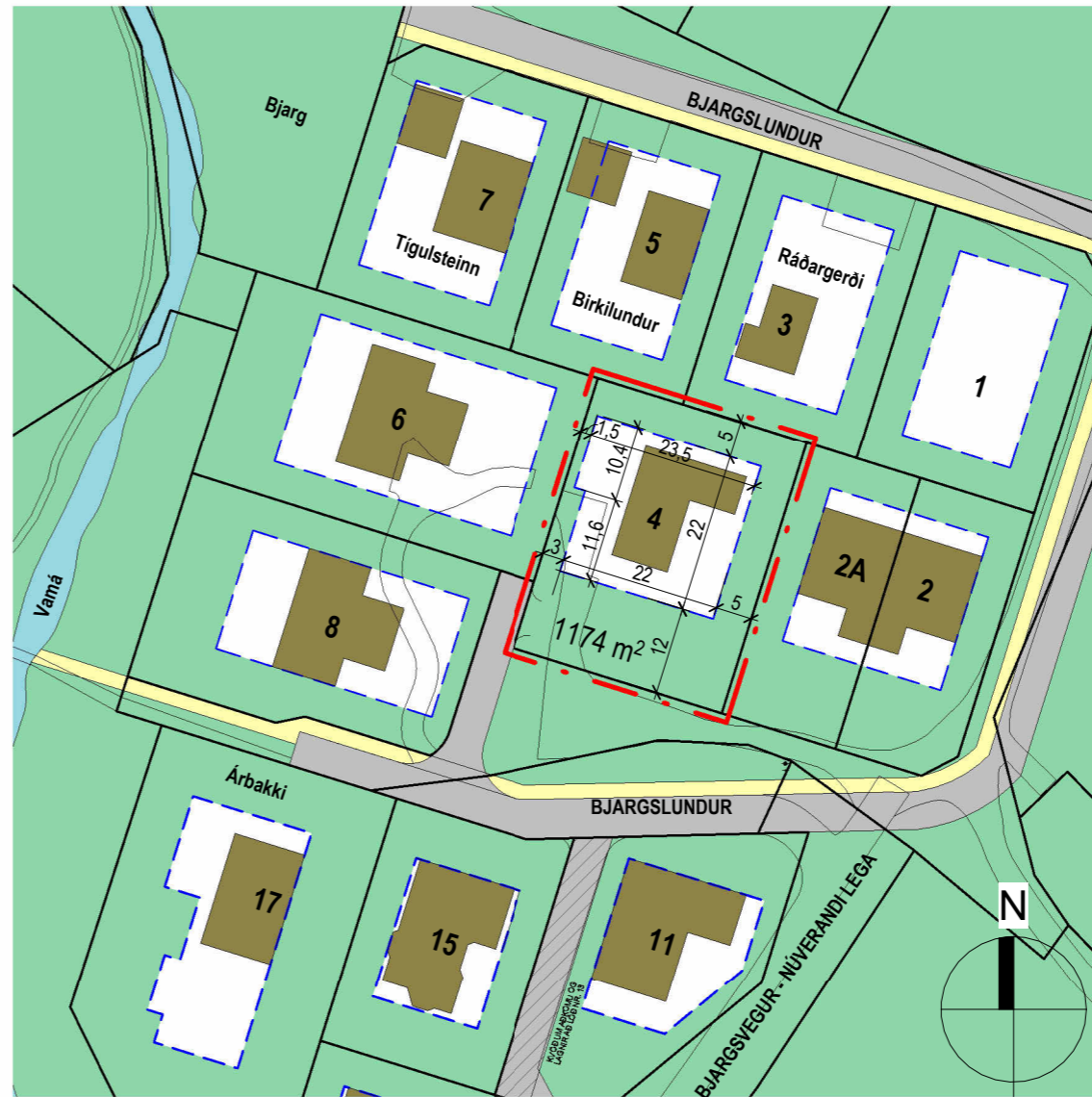
Deiliskipulag eftir breytingu