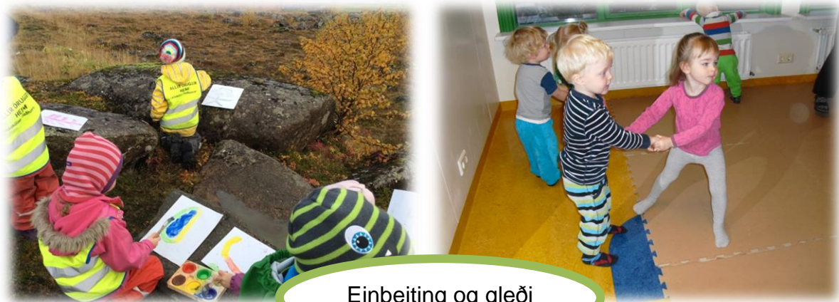
Einbeiting og gleði

Við lítum svo á að barnið sé skapandi og frjór einstaklingur sem hefur margt fram að færa og sköpun og menning sé því mikilvægur þáttur í þekkingarleit þeirra.