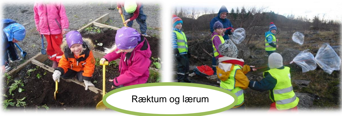
Ræktum og lærum