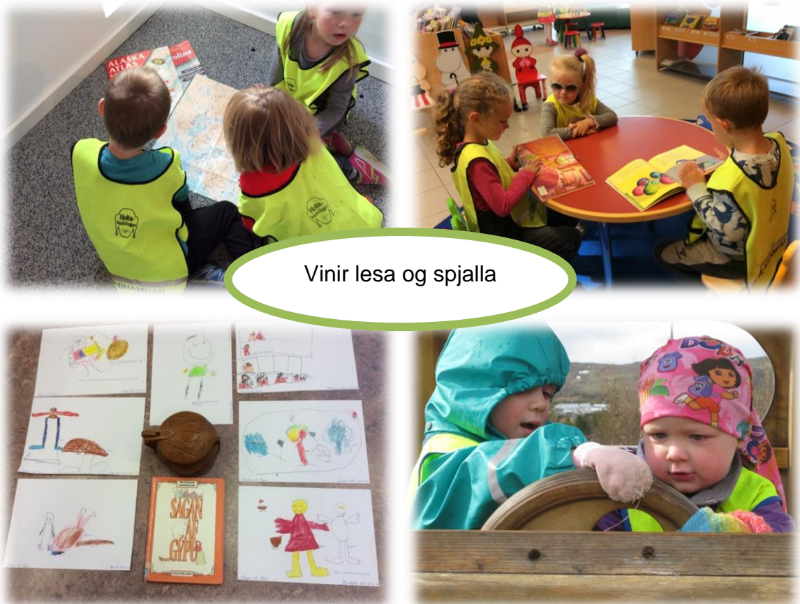
Vinir lesa og spjalla

Málproski barna þróað hratt á fyrstu árum barnsins, markvikss málörvun hefst í leikskólanum við upphaf leikskólagöngu. Það er stefna Mosfellsbæjar að auka lestrarlæsi barna í skólum bæjarins og hver skóli hefur síðan mótað sína stefnu í þeim málum.