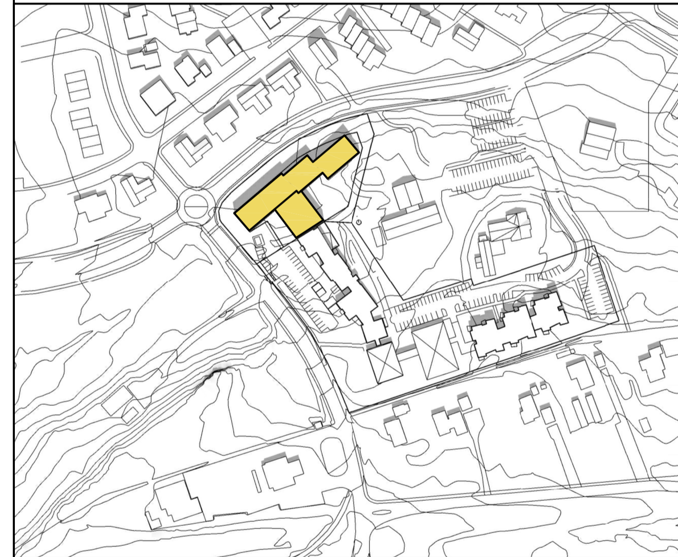
Skuggavarp - 21. júní kl 12.00