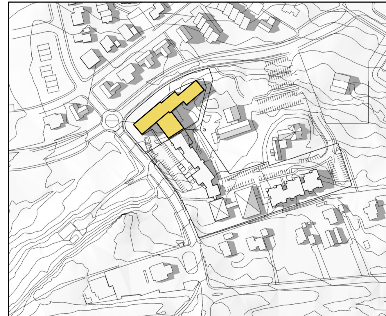
Skuggavarp - 21. júní kl 18.00

Skuggavörpin taka mið af nýbyggingu sem er 3. hæða