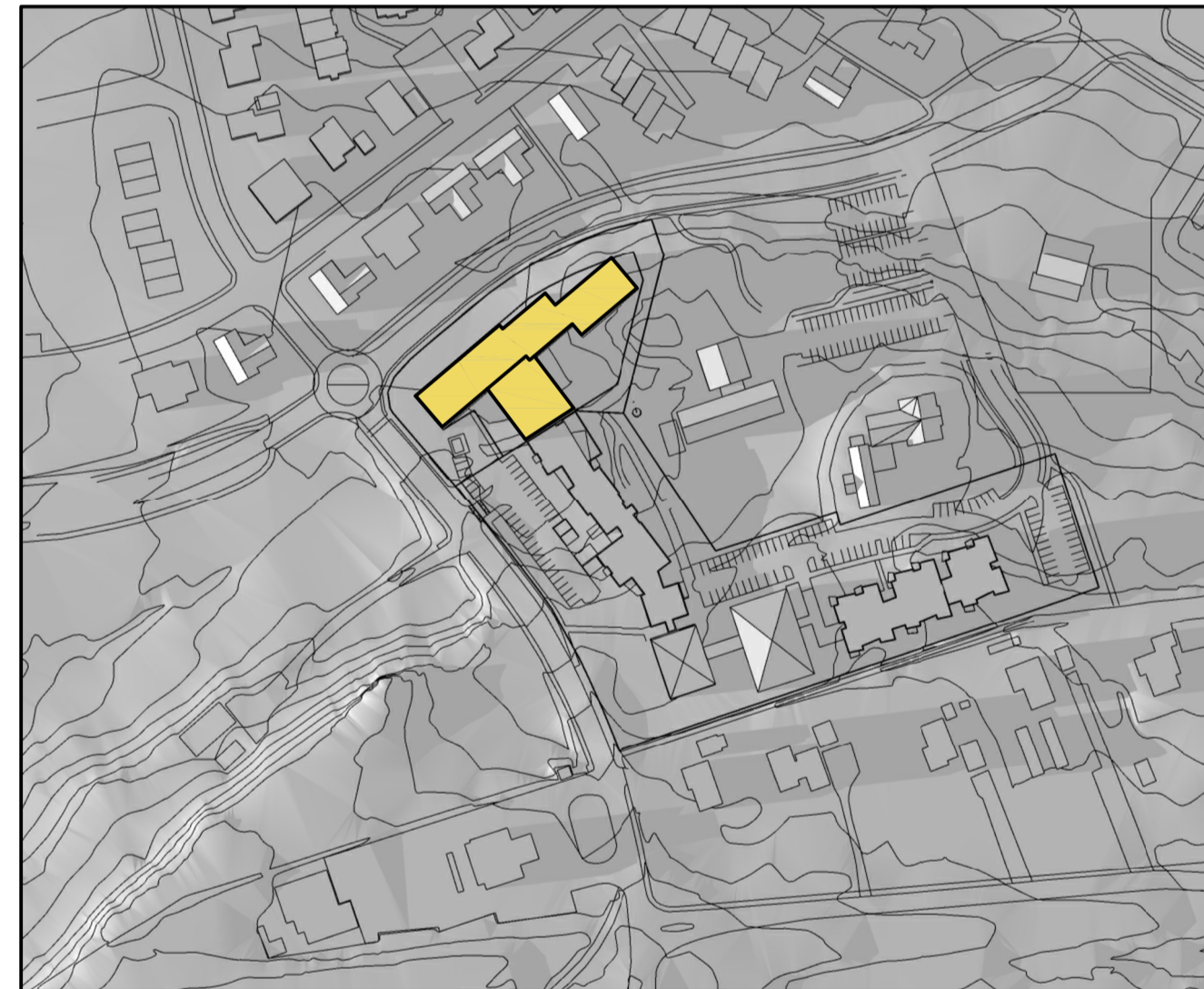
Skuggavarp - 21. mars kl 18.00

Skuggavörpin taka mið af nýbyggingu sem er 3. hæða