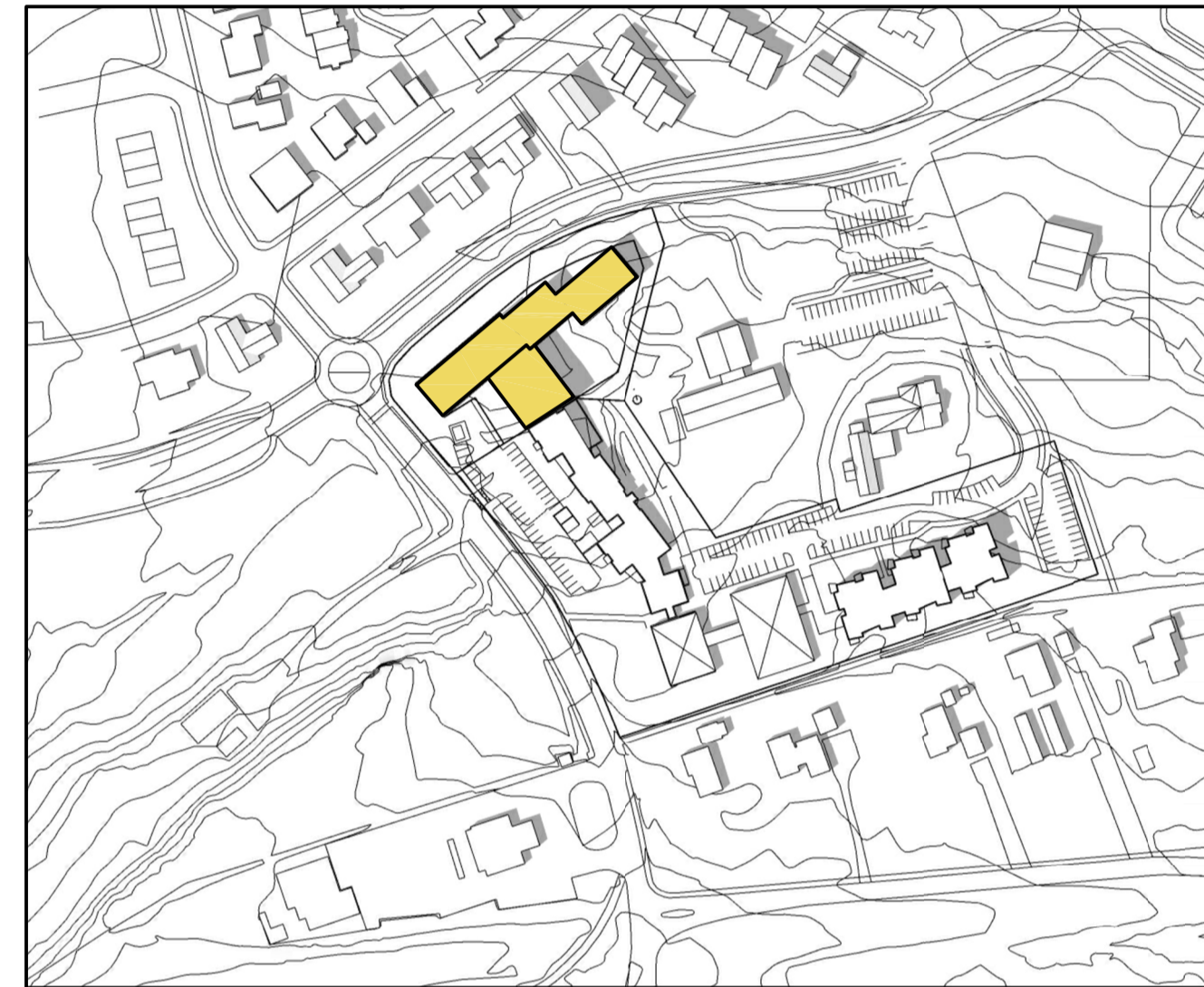
Skuggavarp - 21. júní kl 15.00