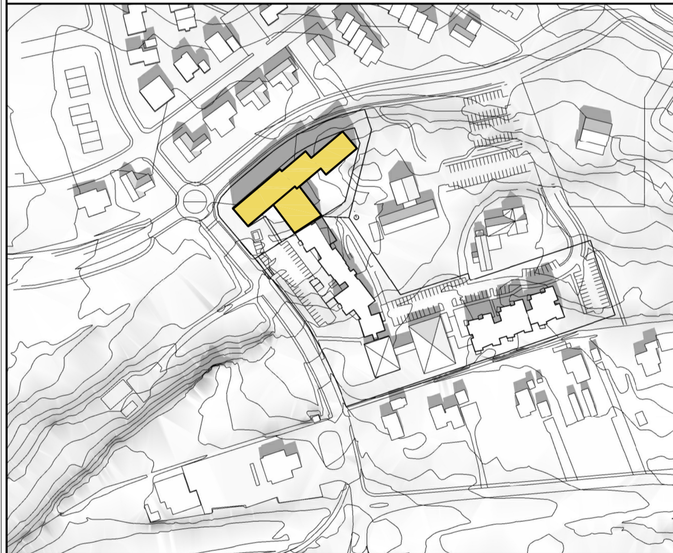
Skuggavarp - 21. mars kl 12.00