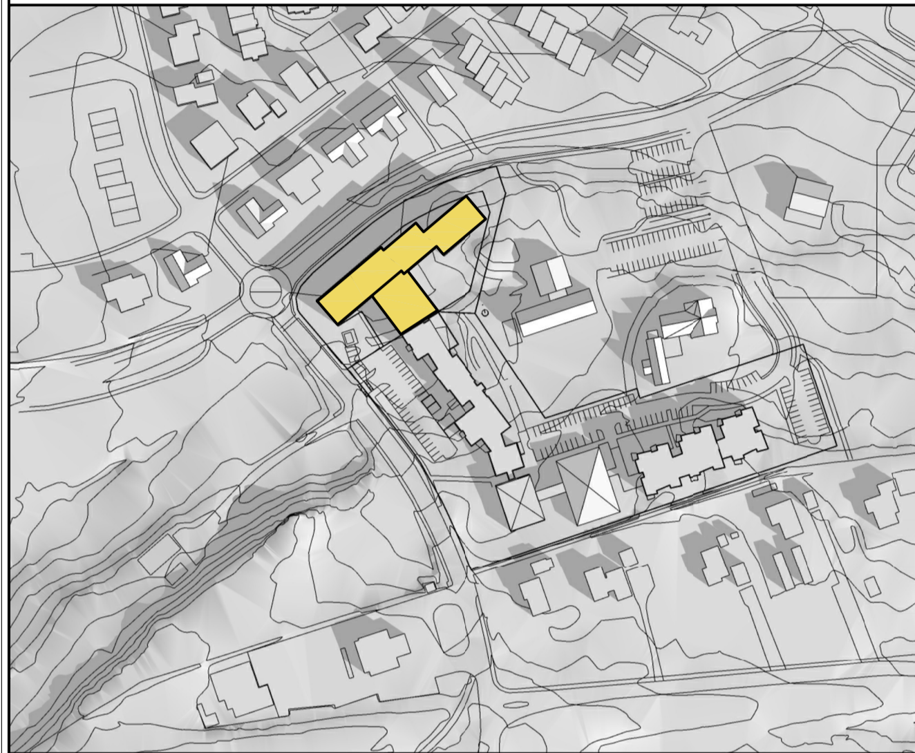
Skuggavarp - 21. mars kl 09.00