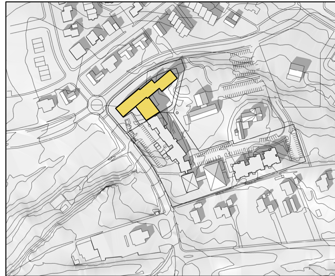
Skuggavarp - 21. mars kl 15.00