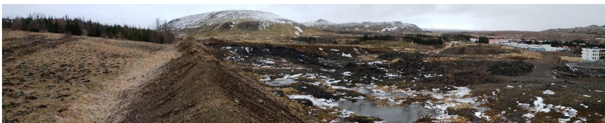
Mynd 4. Horft austur eftir skipulagssvæðinu.

Deiliskipulag er ekki til staðar, en samkvæmt gildandi aðalskipulagi er svæðið skilgreint sem íbúðarsvæði (302-Íb). Í eldra rammaskipulagi segir að byggð skuli vera um 100 íbúðir í sérþýli.