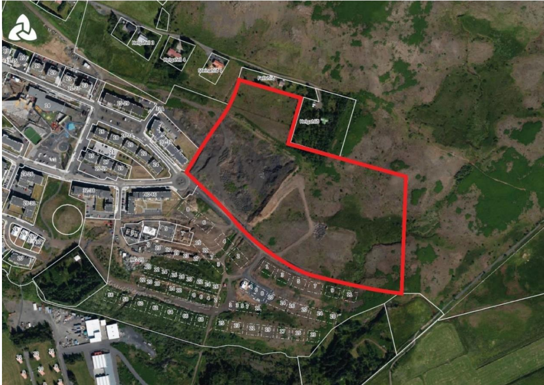
Mynd 5. Deiliskipulagssvæði-loftmynd. Skipulagssvæði markað með rauðri línu.