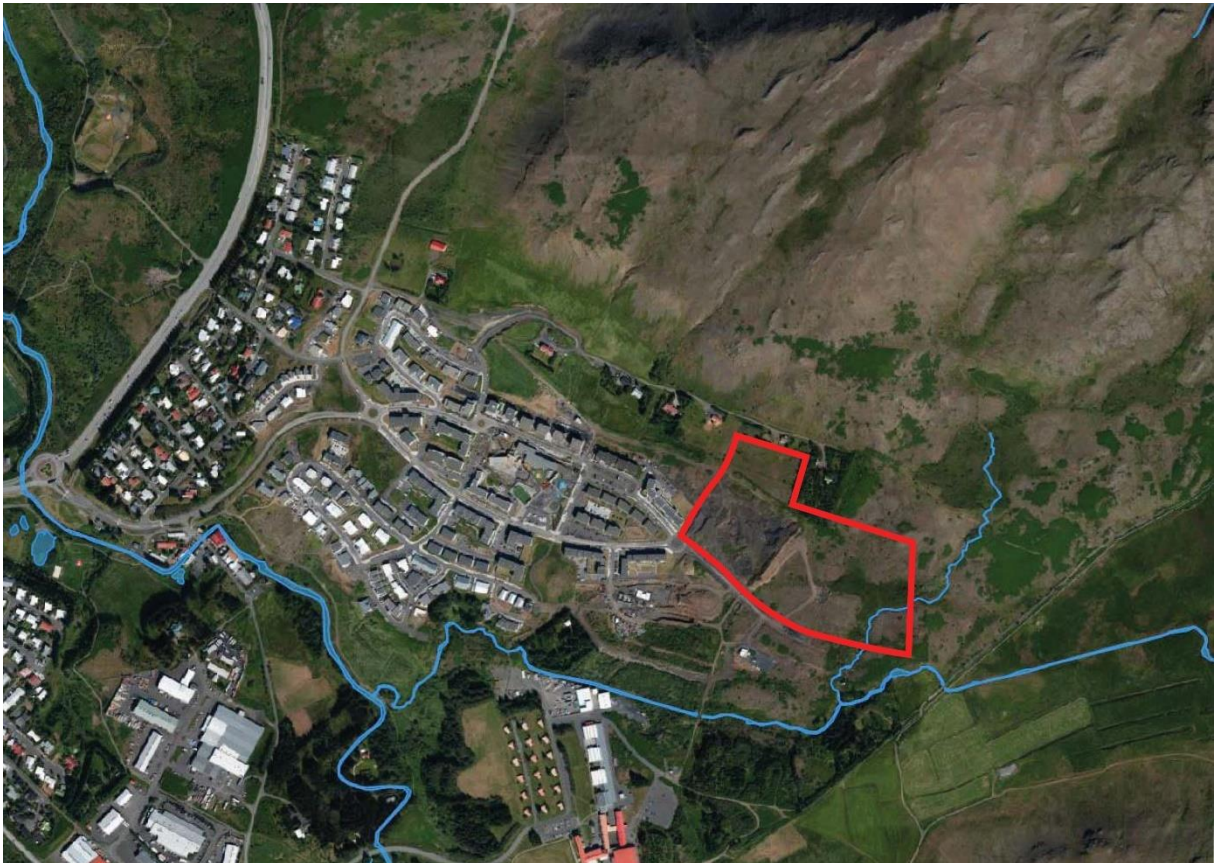
Mynd 1. Loftmynd. Lækir, ár og vötn. - Deiliskipulagssvæði rammað inn með rauðri línu.

Skipulagslýsing þessi var samþykkt til kynningar af bæjarstjórn Mosfellsbæjar þann 27.01.2021.