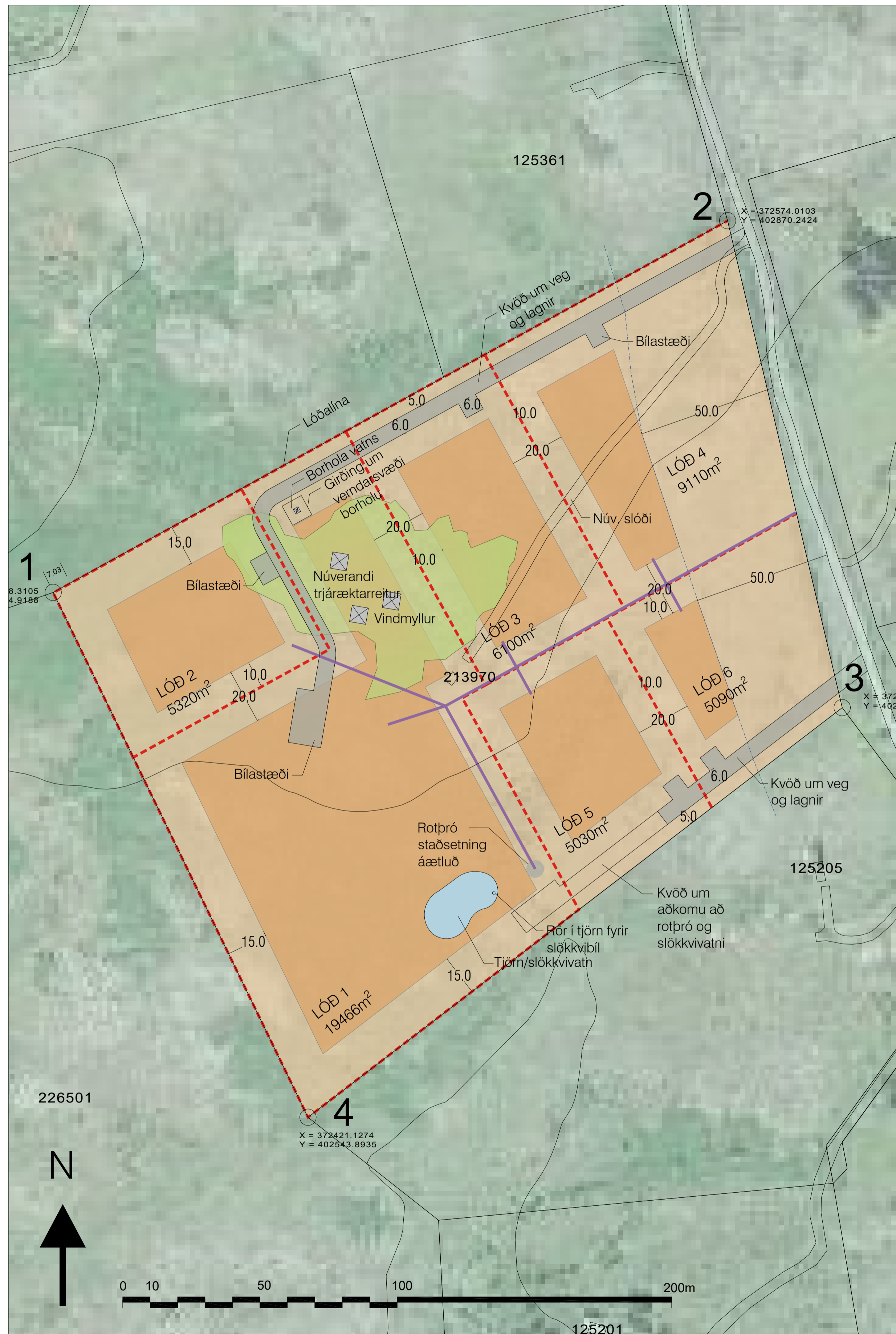
Deiliskipulag mkv. 1:1000