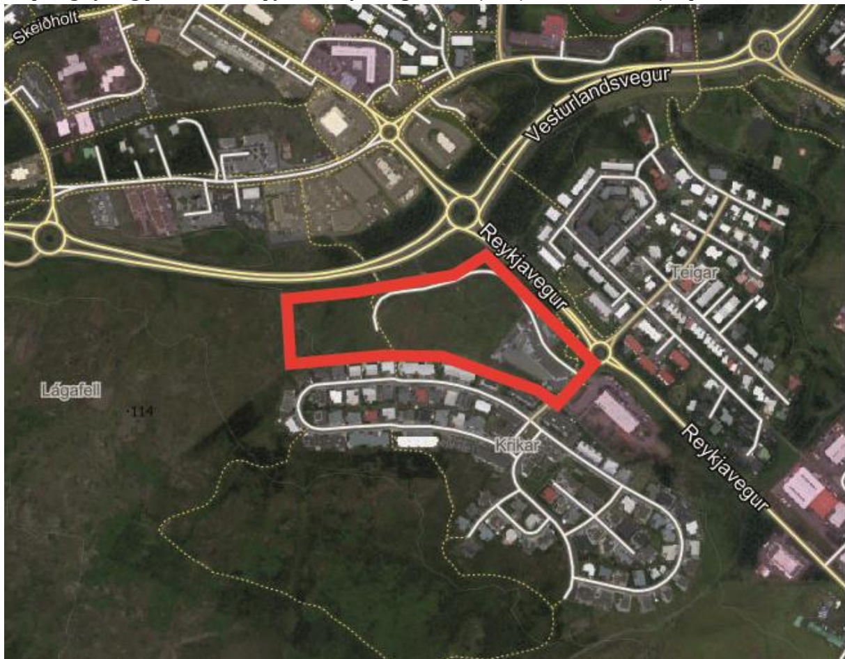
Mynd 1. Aðalskipulags- og deiliskipulagsvæði má sjá í rauðu. Loftmynd frá árinu 2021.

Skipulagslýsing þessi var samþykkt til kynningar af bæjarstjórn Mosfellsbæjar þann 09.02.2022.