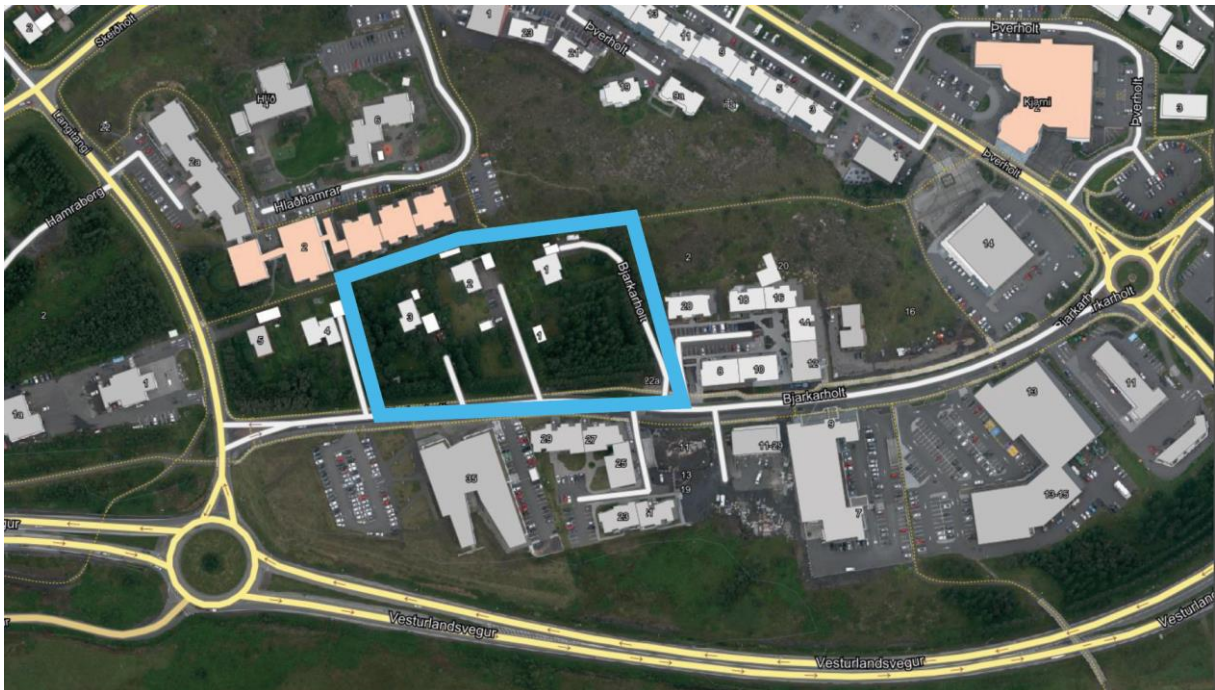
Mynd 5. Bjarkarholt 1, 2 og 3 sem deiliskipulagsbreytingin mun ná til.

Við Bjarkarholt er í gildi deiliskipulag sem samþykkt var þann 22.12.2010. Áætluð er deiliskipulagsbreyting samhliða aðalskipulagsbreytingunni sem tengist þremur lóðum við Bjarkarholt, í dag númeraðar 1, 2 og 3. Um er að ræða svæði innan uppbyggingarreitar E í deiliskipulagi og inniheldur áætlun um uppbyggingu húsnæðis og miðbæjargarðs. Gerð hefur verið breyting fyrsta hluta svæðisins sem tilgreinir uppbyggingu 100 eininga fyrir þjónustuíbúðir aldraðra. Breytingin var samþykkt 08.12.2021. Deiliskipulagsbreyting þessi er seinni áfangi þeirrar áætlunar.