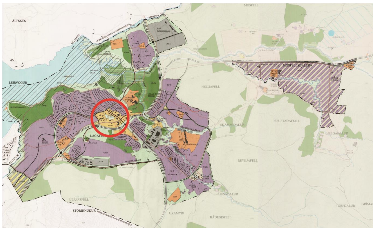
Mynd 1. Þéttbýlisuppdráttur aðalskipulags Mosfellsbæjar 2011-2030, miðsvæði 116-M merkt með rauðu.

Skipulagslýsing þessi var samþykkt til kynningar af bæjarstjórn Mosfellsbæjar þann 26.01.2022.