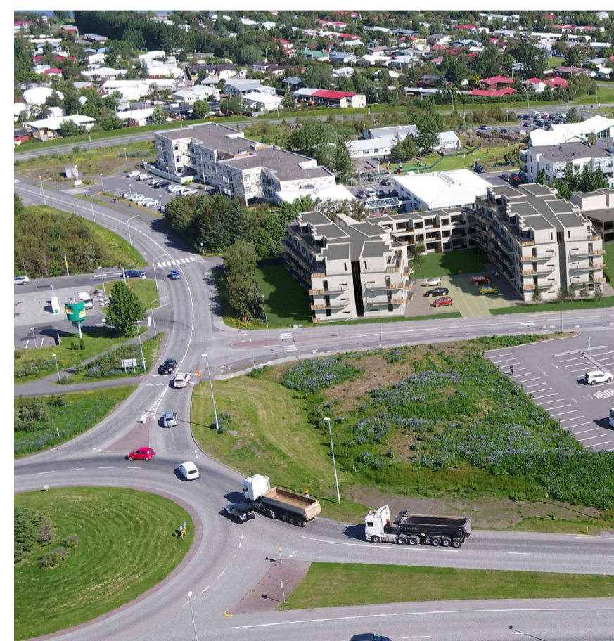
Tillöguuppdráttur til skýringar fyrir mögulega uppbyggingu

Einnig verður byggð ein hæð ofan á þjónustubyggingu sem mun rúma þjónusturými við íbúðirnar á svæðinu.