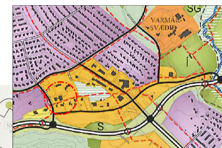
ÚRDRÁTTUR ÚR ADALSKIPULAGI 2011-2030.