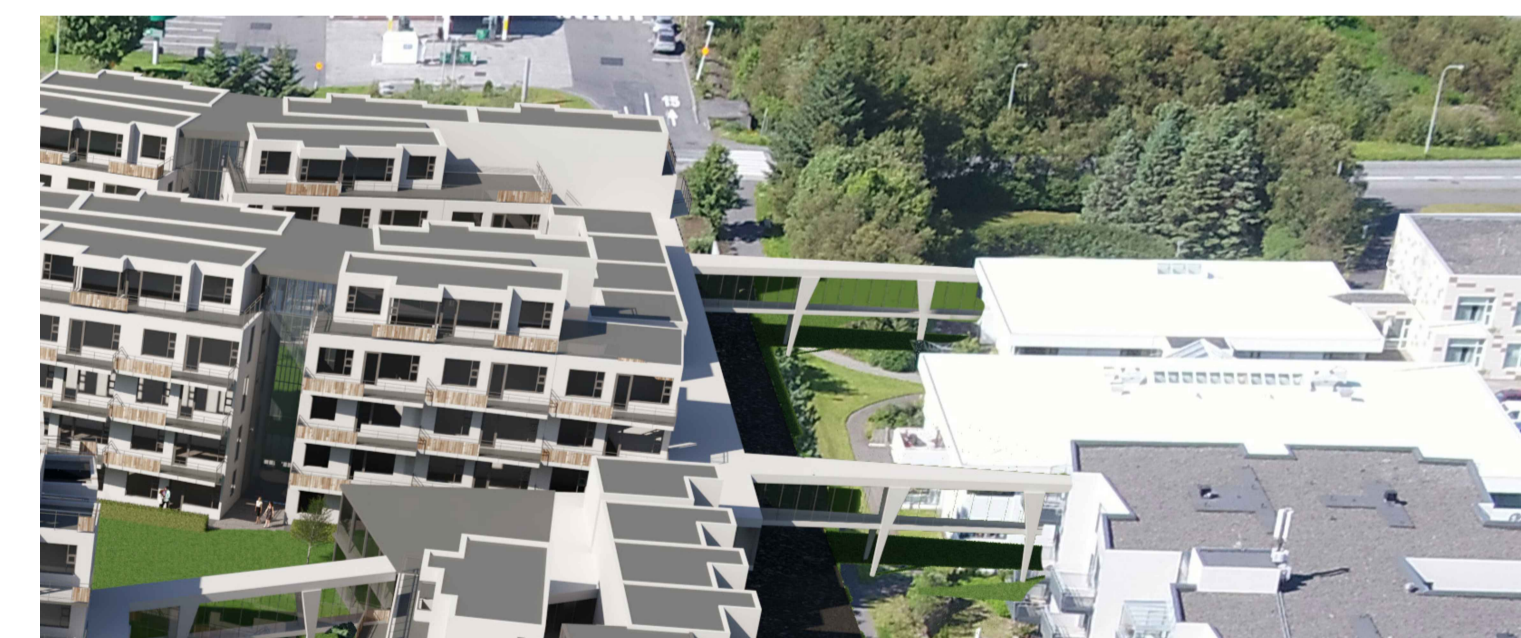
Tillöguuppdráttur til skýringar fyrir mögulega uppbyggingu