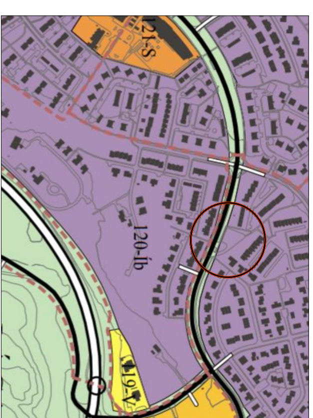
Aalskipulag Mosfellsbæjar 2011-2030

Lögð eru niður stæði fyrir stóra bíla Svæðinu breytt í svæði fyrir grendargáma