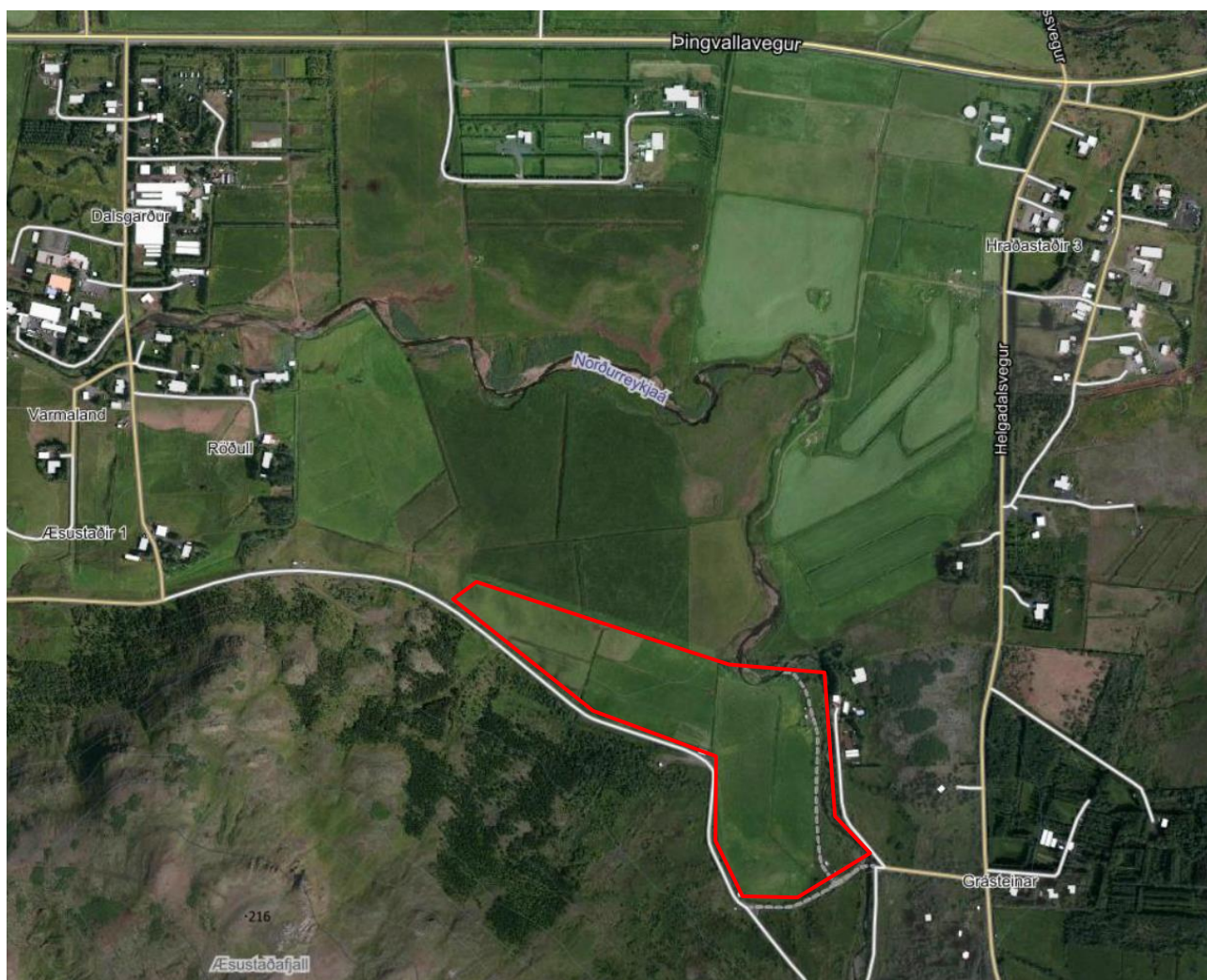
Mynd 1. Afmörkun skipulagssvæðisins (afmarkað með rauðu)

Spildurnar eru samliggjandi meðfram vegarslóða við rætur Æsustaðafjalls og liggja að og meðfram Suðurá að austan. Samanlögð stærð spildnanna og þar með skipulagssvæðisins er 9,7 ha.